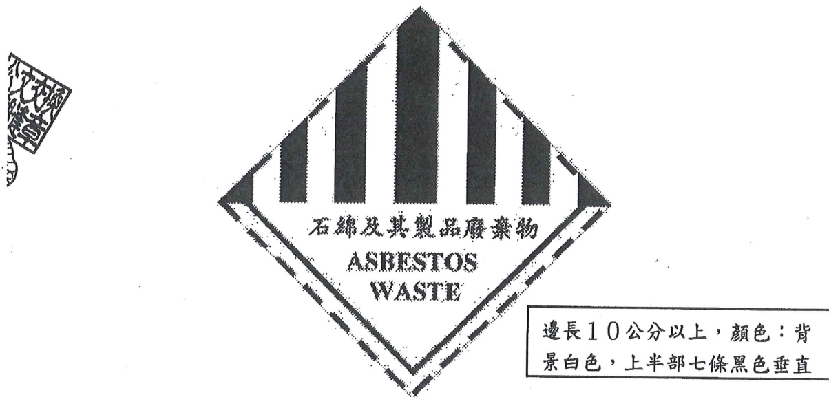
圖 2、有害事業廢棄物特性之標誌-石綿及其製品廢棄物