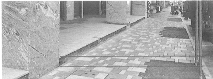
騎樓地面與人行道齊平

五、 繼續宣導，配合步行城市政策—建築基地涉騎樓或無遮簷人行道者—申領使用執照時，建築物竣工照片（各向立面，應能辨識騎樓與相鄰二側、面前道路，高程關係）。