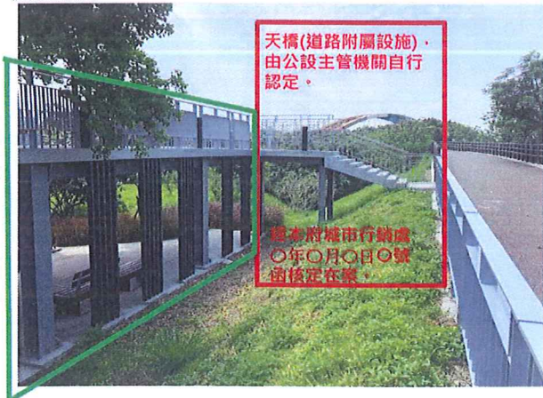
建築物留設空間與天橋連接 供公眾使用

一. 建築物銜接道路附屬工程設施，非屬建築執照內容者，另依其公共設施目的事業主管機關規定辦理（照會：城市行銷處）。