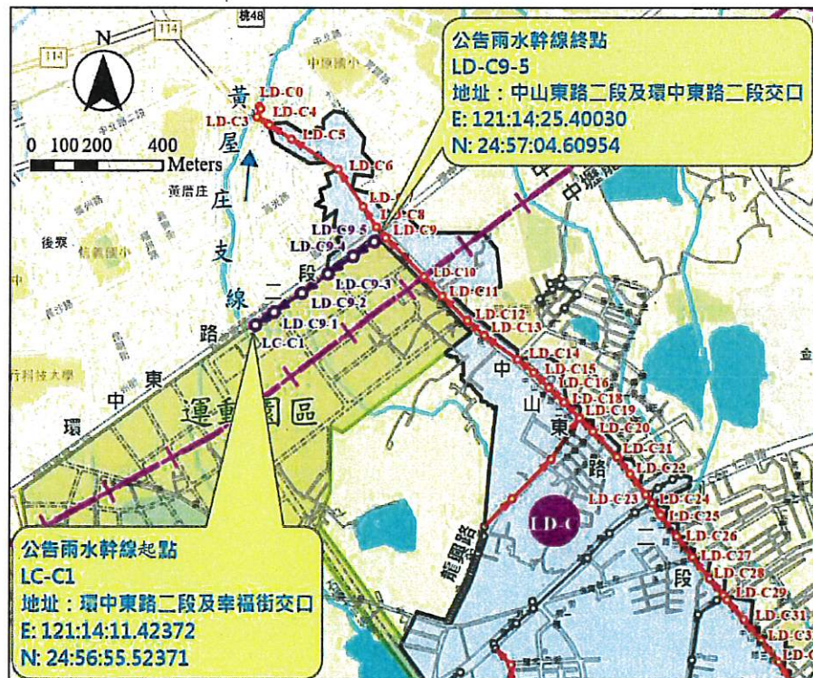
LD-C9 支線排水區域範圍圖