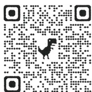
掃 QR CODE 直接下載檔案