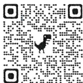
掃 QR CODE 直接下載檔案