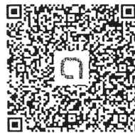
掃 QR CODE 加入社群於記事本裡下載檔案。