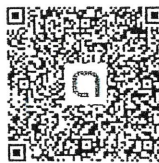
掃 QR CODE 加入社群於記事本裡下載檔案。