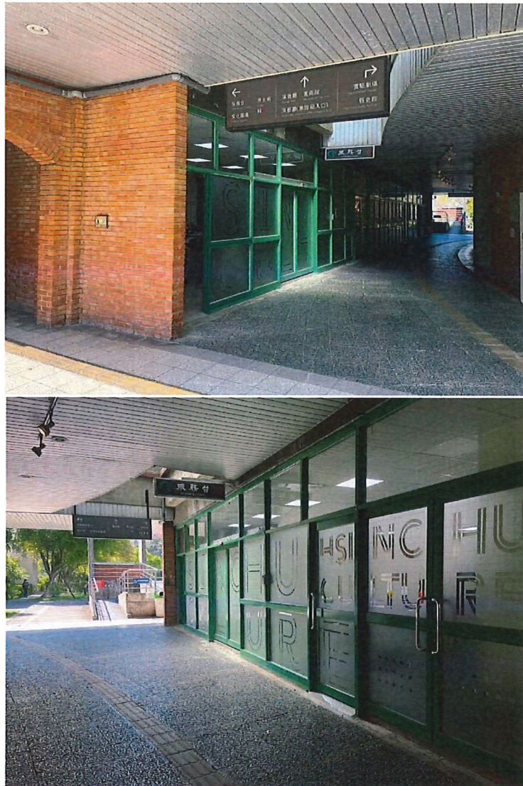
圖 課程教室照片與位置