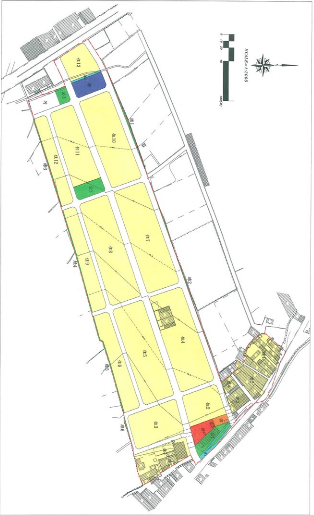
圖名： 圖3-2 土地使用計畫圖