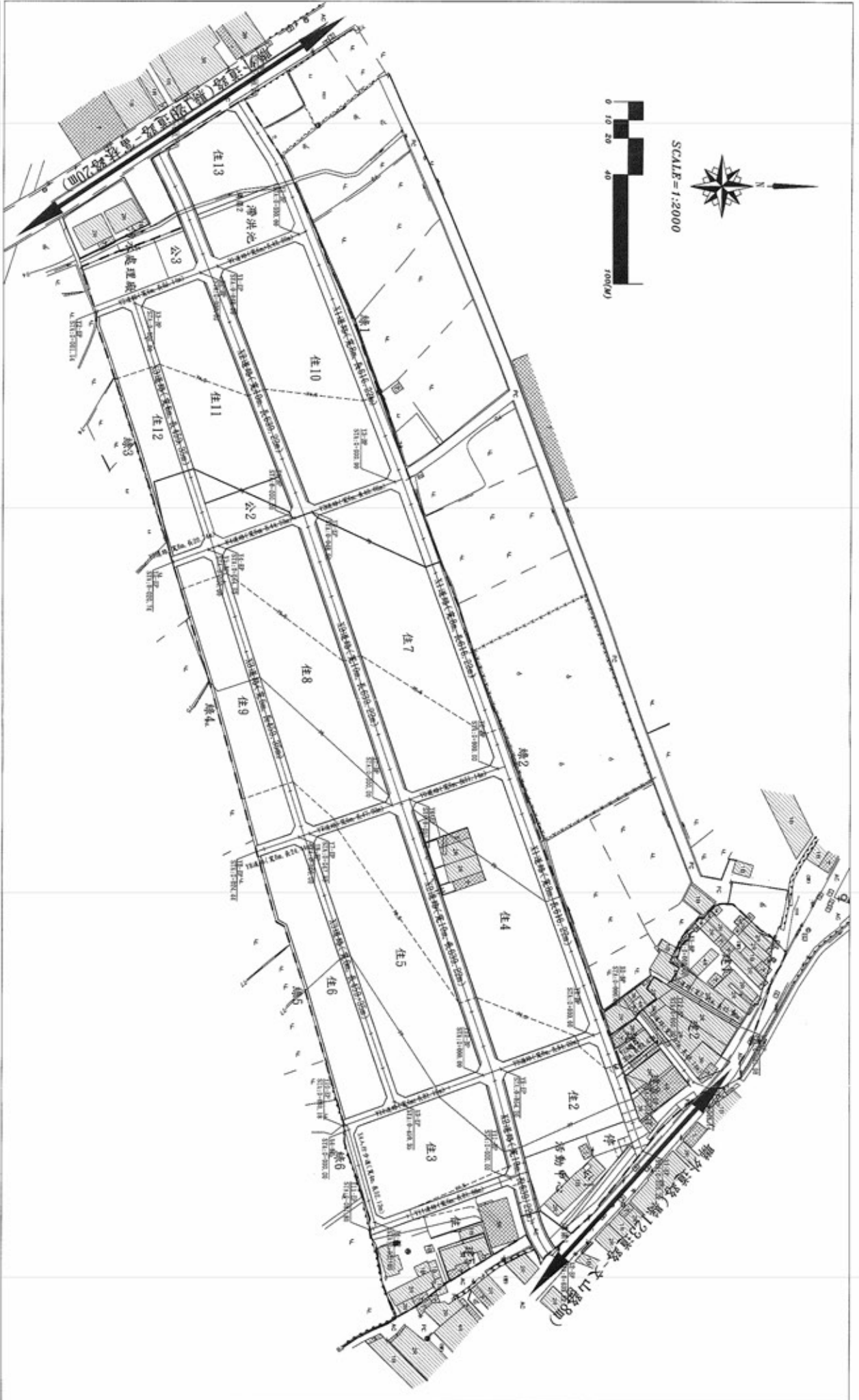
圖名： 圖3-7 道路系統計畫圖